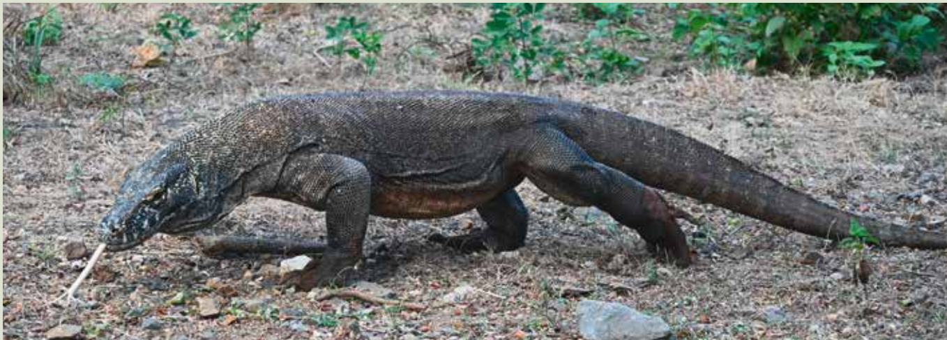
Auf der Suche nach dem Drachen?

ten. Erst im Zuge der Verwandlung zum Fabelwesen sei der Drache zum Tier geworden.