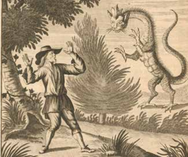
Der Tatzelwurm: Alpiner Berg-Drachen mit katzenartigem Kopf (Stich von Johann Jakob Schleuchzer, 1723)