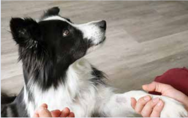
Kate geht individuell auf den Charakter der Patienten ein