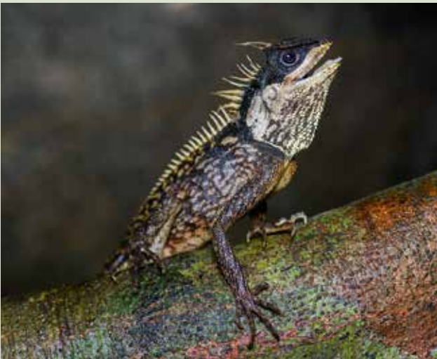
Der Phuket-Nackentachler, eine erst vor wenigen Jahren entdeckte Agamenart