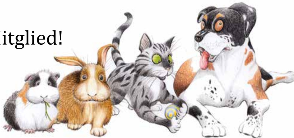
Illustration: Andrea Tändler

■ Ja, ich möchte Mitglied beim Tierschutzverein Bochum, Hattingen und Umgebung e. V. werden.